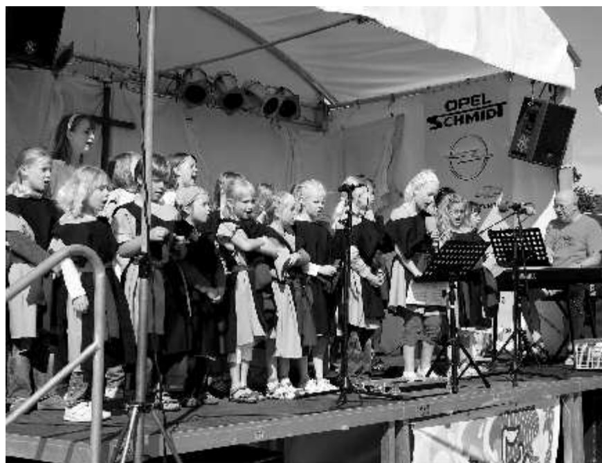
Kinderchor Young Voices Pfingstsonntag 2009